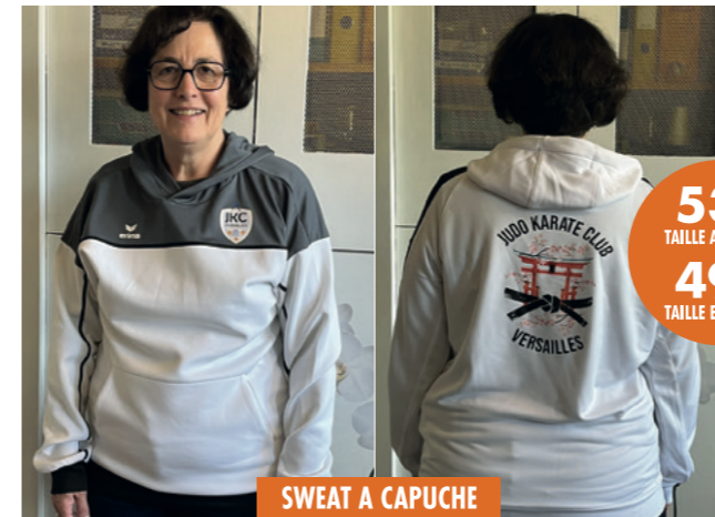
SWEAT A CAPUCHE

COMMANDEZ VOTRE SWEAT A CAPUCHE OU VESTE D'ENTRAINEMENT